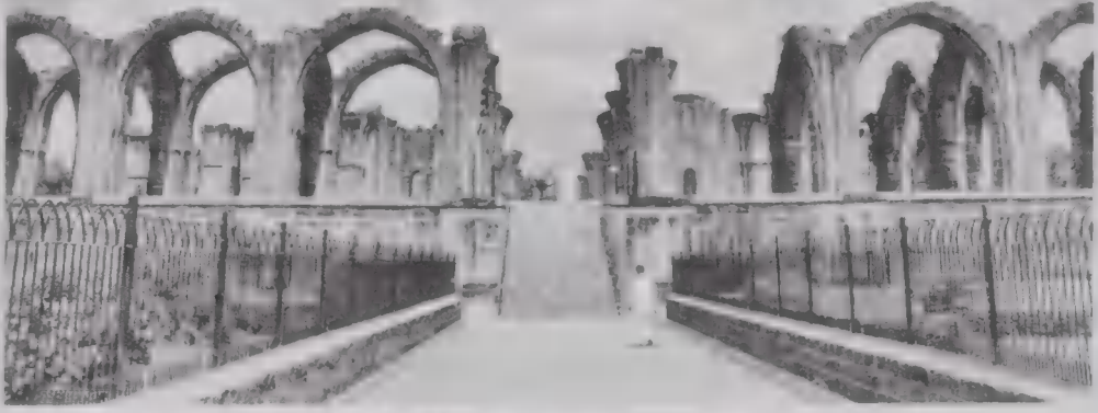
ಒಂದನೆಯ ಆದಿಲ್ ಶಹ ಕಟ್ಟಿಸಿದ ಬಾರಾಕಮಾನ, ಬಿಜಾಪುರ

ಪ್ರಕಾರಗಳಲ್ಲಿ ಅಸಾಮಾನ್ಯ ಪ್ರಾವೀಣ್ಯ ಹೊಂದಿದ್ದನಂತೆ! ಲಿಪಿಗಳಲ್ಲಿ ನಿಷ್ಣಾತರಾಗಿದ್ದ ದೇಶ-ವಿದೇಶಗಳ ಕಲಾಕಾರರನ್ನು ಆಸ್ಥಾನಕ್ಕೆ ಬರಮಾಡಿಕೊಂಡಿದ್ದ. ಅಲ್ಲದೇ ಆ ಪರಿಣತ ಕಲಾಕಾರರ ಪ್ರತಿ ಎತ್ತುವವರ ತಪ್ಪುಗಳನ್ನು ಕಂಡುಹಿಡಿಯುವಷ್ಟು ಸೂಕ್ಷ್ಮಗ್ರಾಹಕತ್ವವನ್ನು ಬೆಳೆಸಿಕೊಂಡಿದ್ದ. ಇದೇ ಸಂಪ್ರದಾಯ ಆತನ ಸಾಕು ಮಗ ಇಮ್ಮಡಿ ಇಬ್ರಾಹಿಮನ ಕಾಲದಲ್ಲಿ ನಡೆದುಬಂದಿತು.